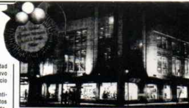
Multitienda SOCOMI Valparaíso

Asesoría Habitacional Asesoría Jurídica Créditos de Consumo, de Libre Disponibilidad y Automotriz Convenio con Supermercado Santa Isabel Cabañas de Veraneo Servicio Radiológico Servicio de Atención Dental Servicio de Mudanza Servicio Funerario Centros de belleza y peluquería Convenio con Farmacias Cruz Verde