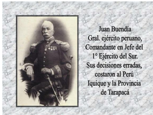
Juan Buendía Gral. ejército peruano, Comandante en Jefe del 1° Ejército del Sur. Sus decisiones erradas, costaron al Perú Iquique y la Provincia de Tarapacá

El ejército aliado boliviano-peruano en Tarapacá se encontraba al mando del General Juan Buendía con su cuartel general en Iquique, quien visitó Pisagua dos días antes del desembarco chileno. La victoria de las fuerzas chilenas en Pisagua significó la separación de las fuerzas aliadas, una parte de ellas quedó en Tacna y Arica, la otra en Iquique.