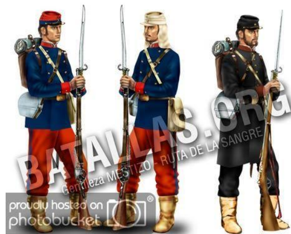
INFANTERIA DE LINEA 1880 (Buin 1o, 2o, 3o, 4o y Santiago)

Atacama fue y sigue siendo tierra de grandes esfuerzos, los atacameños que se enrolaron en ambos batallones sabían lo que significaba soportar la fatiga, muchos de ellos eran pirquineros que recorrieron montes y quebradas buscando el metal precioso, lo mismo los agricultores de los valles de Copiapó y Huasco, de los pescadores que circundaban Chañaral, Caldera y Huasco, también los escolares y comerciantes, gente de gran garra y corazón fuerte cuyo espíritu nunca decayó.